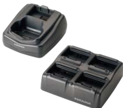
Einfach Lade-/Übertragungsstation und mehrfach Akkuladestation